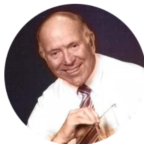
Sr. Griffith Harlow (Carolina del Norte, EEUU) 'El Cenacle' vol.86.5 – © The Upper Room

Querido Dios, gracias porque incluso los actos simples pueden ser realizados en el nombre de Jesús. Ayúdanos a compartir continuamente tu amor con los demás.